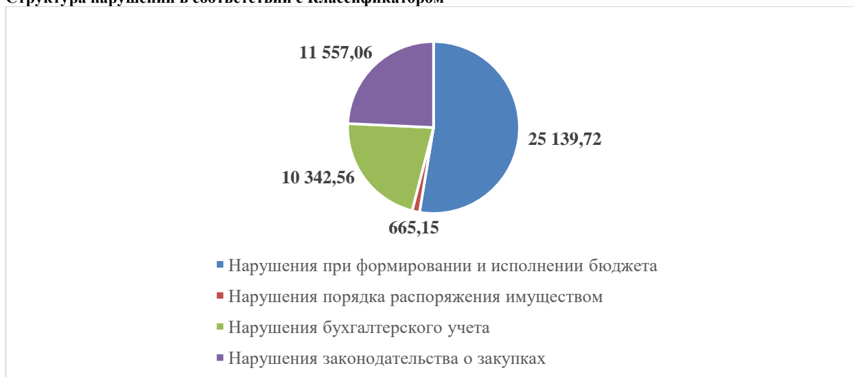
Диаграмма № 3